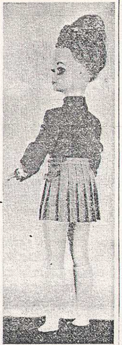
If a doll like Sara-Jane ever had to do a day's work, this is the sort of outfit she would wear—a jersey wool top with a permanently-pleated skirt, and trendy white knee socks.